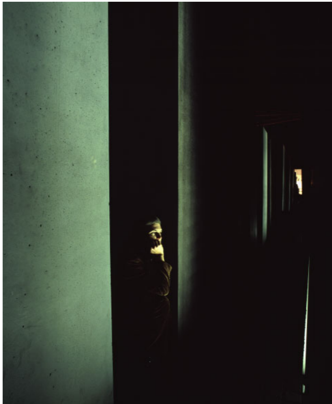
Abb. 1 | Warten.