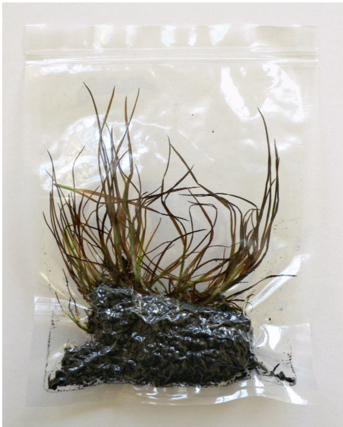
Abb. 10 | Erde aus dem »Kleinen Lager«, vacuumiert.