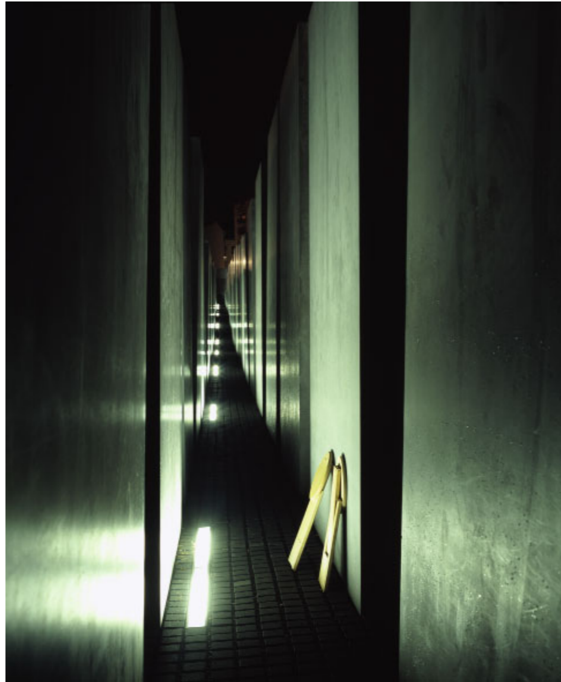
Abb. 18 | Stühle im Stelenfeld.