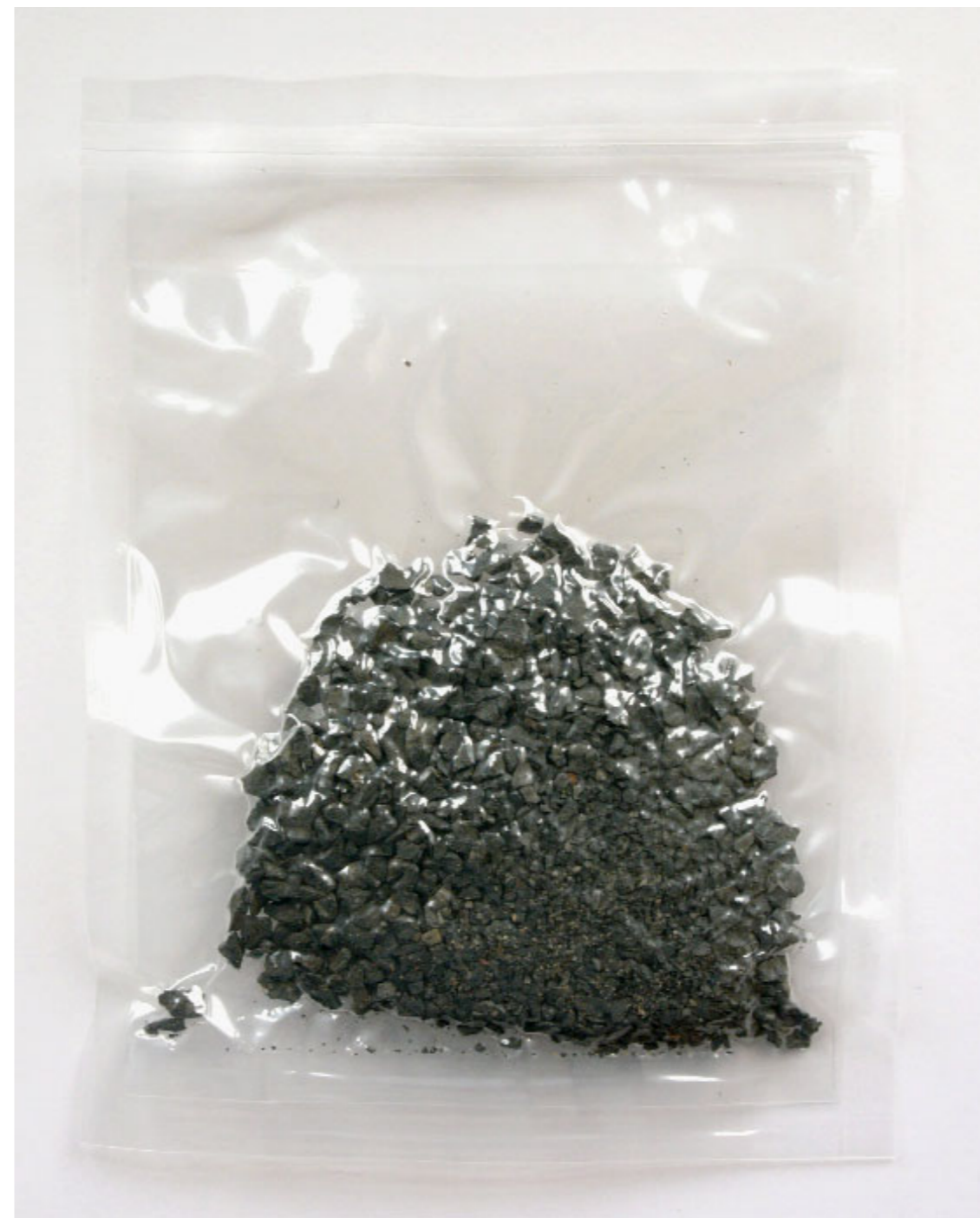
Abb. 11 | Kies, vacuumiert.