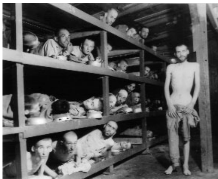
Abb. 9 | »Kleines Lager«, 1945.

So sehe und sah ich meine Aufgabe darin, das Fundament für einen Dialog zu legen, damit die Erinnerung wach bleibt.