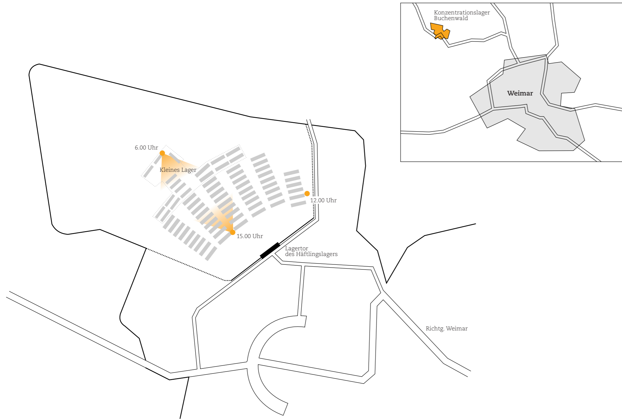
Abb. 2 | Lageplan des Konzentrationslagers Buchenwald mit auszugsweiser Darstellung des Häftlingslagers, des Kleinen Lagers, den Dokumentationsstandpunkten und deren Blickwinkeln.