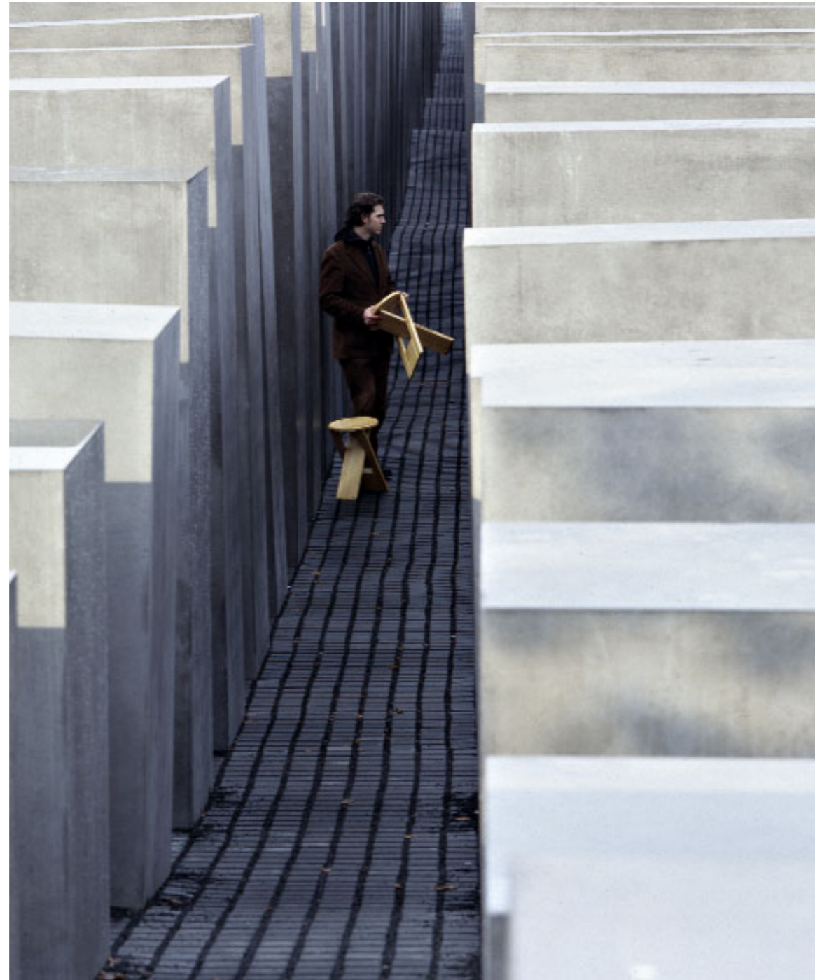
Abb. 12 | Vorbereitung.